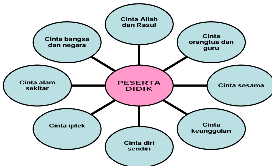
Gambar 1 Cinta 360 Derajat

dipilih; (3) respect , usia 9 s.d. 11 tahun, memperlakukan orang lain sebagaimana diri sendiri ingin diperlakukan; (4) fairness , usia 11 s.d. 13 tahun, mengikuti aturan, tidak berprasangka buruk, tidak mudah menyalahkan orang lain; (5) caring , usia 13 s.d. 17 tahun, ditanamkan sejak remaja, yakni ramah, peduli orang lain, memaafkan, dan membantu mereka yang memerlukan; dan (6) citizenship , usia 18 tahun ke atas, tahapan mulai dewasa, warga negara yang baik, bertanggung jawab, demokrasi, berperan membangun komunitas, bekerja sama, dan mematuhi hukum. Sedangkan proses pendidikan karakter seperti Gambar 2.